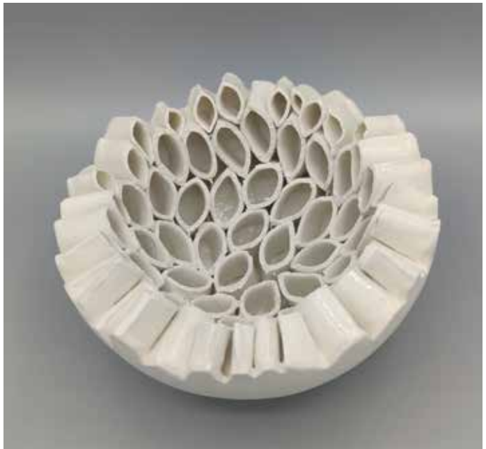
Wabenschale H 10 cm, B 18 cm