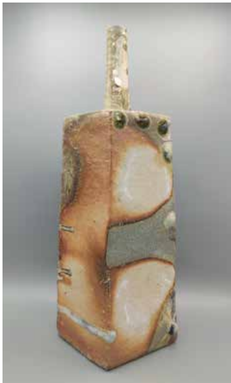
Fumaiolo legno H 42 cm, B 13 cm