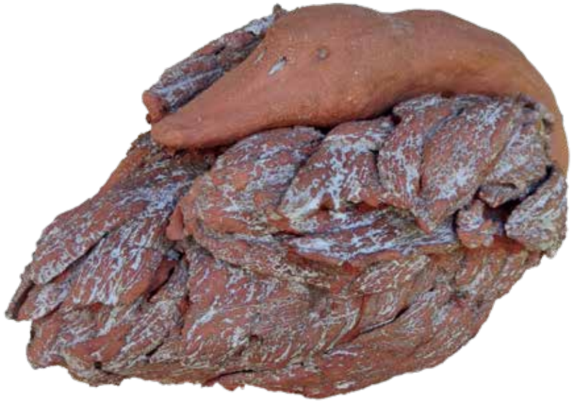
ruhender Schwan H 25 cm, B 40 cm