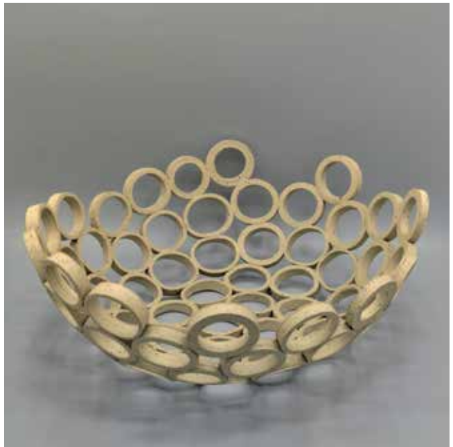
Ringschale H 15 cm, B 34 cm