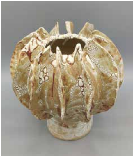
Flügel I H 25 cm, B 20 cm