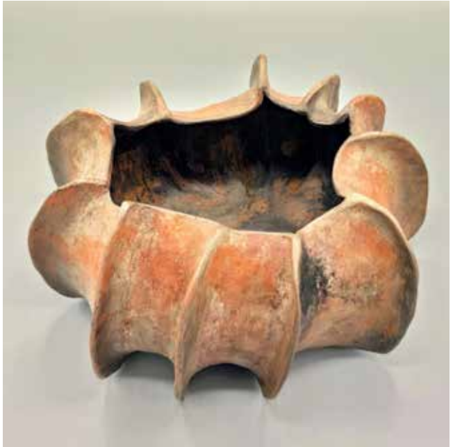
Organika H 15 cm, B 25 cm