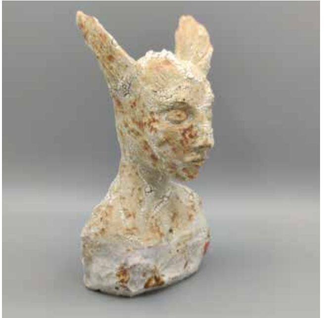
Identität H 23 cm, B 13 cm