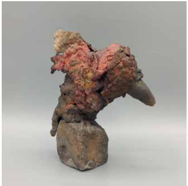
Rabe flieg H 14 cm, B 10 cm