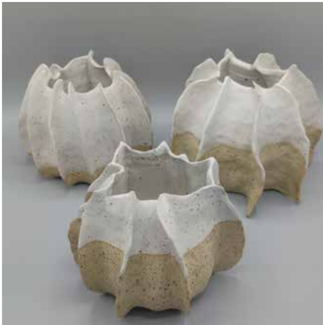
Flügel II H 15 cm, B 18 cm