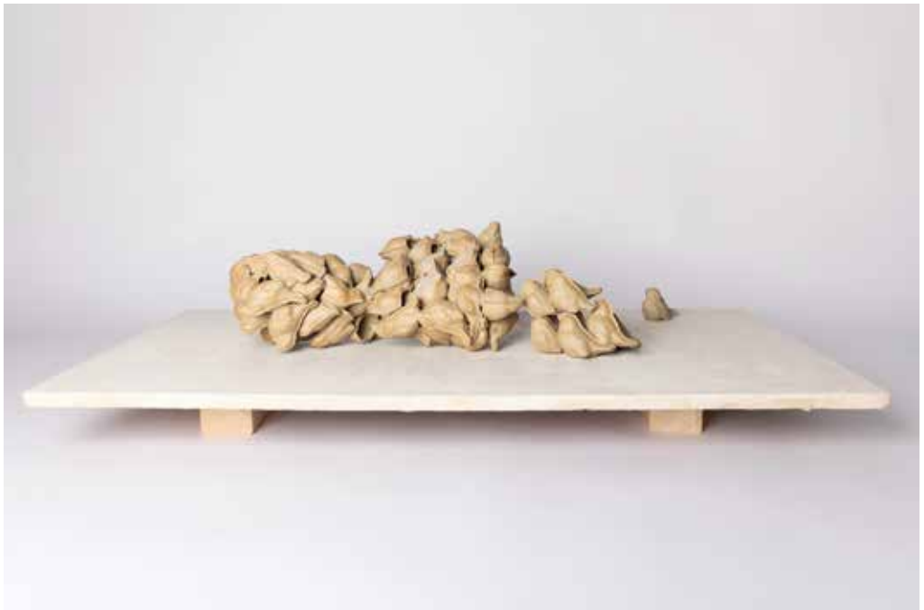
Epilog des Anfangs H 25 cm, B 108 cm