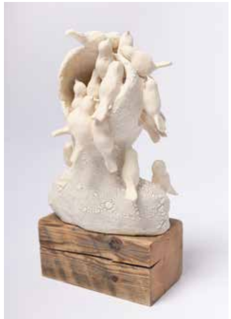
links Gedankenflug H 24 cm, B 17 cm