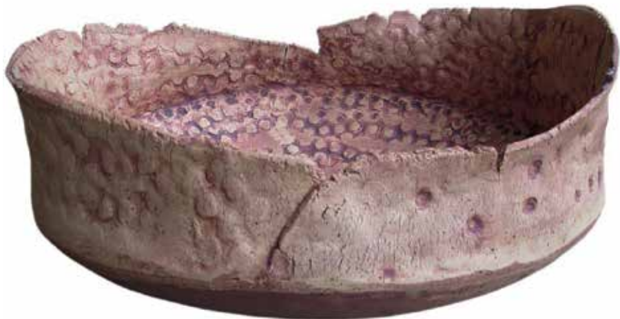
Morinesio H 24 cm, B 56 cm